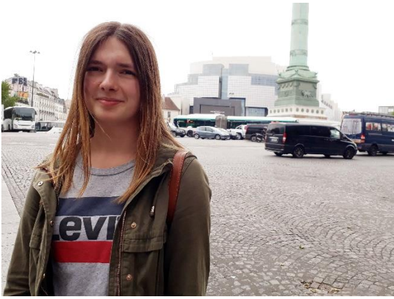
←Place de la Bastille